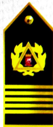
Platina sobreposta Amovível