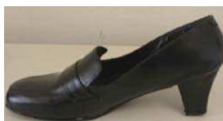
Sapato preto de salto médio feminino

Descrição: sapato preto social de salto médio feminino, tipo scarpin , pouco decotado, de bico arredondado, confeccionado em couro, sem enfeites. Apresenta salto médio e largo com 50 mm de altura na cor preta. A parte interna é toda forrada com raspa de couro e tecido. Com solado de borracha vulcanizada ou de couro. Sua posse é facultativa para todas as Inspetoras, Subinspetoras, Classes Distintas Femininas e Guardas Civis Femininas. Seu uso se dá em atividades de cunho administrativo ou social em composição com o uniforme com saia reta ou calça social. Fica vedado o uso do sapato preto social de salto médio em conjunto com a calça operacional.