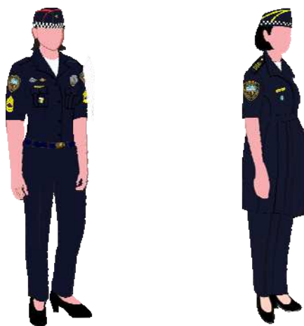
Composição do uniforme feminino com calça e sapato social

Descrição: os uniformes femininos incluídos nesta Portaria admitem, de acordo com a missão e a ocasião, as seguintes variáveis: