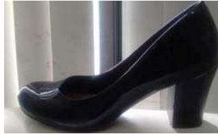
Sapato preto de salto alto feminino

Descrição: sapato preto social de salto alto feminino, modelo clássico, decotado, de bico arredondado de médio para fino, confeccionado em vaqueta cromada ou pelica preta, com borda pespontada, sem enfeites. Apresenta salto alto e grosso com 75 mm de altura na cor preta. A parte interna é toda forrada com raspa de couro e tecido. Com solado de borracha vulcanizada ou de couro. Sua posse é facultativa para todas as Inspetoras, Subinspetoras, Classes Distintas Femininas e Guardas Civis Femininas. Seu uso se dá em atividades de cunho social em composição com o uniforme com saia reta ou calça social. Fica vedado o uso do sapato preto social de salto alto em conjunto com a calça operacional.