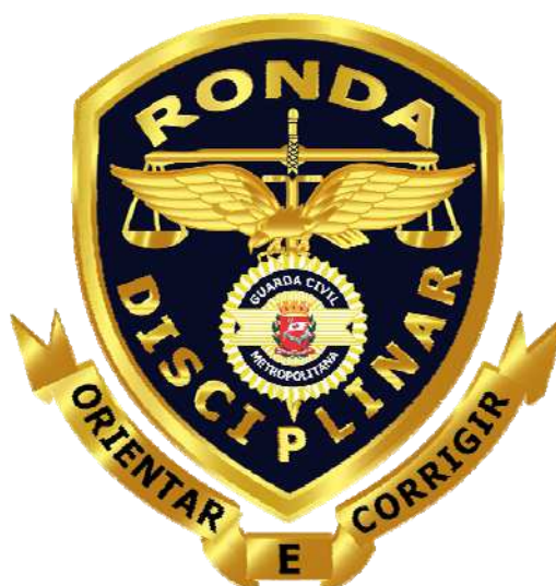
Emblema da Ronda Disciplinar Oficial – RDO

Descrição: o Emblema da Ronda Disciplinar Oficial - RDO, da Guarda Civil Metropolitana é composto por um escudo espanhol estilizado, com o Emblema da Guarda Civil Metropolitana no alto da metade inferior do escudo. O Emblema da GCM é encimado por uma figura estilizada de uma águia, símbolo de imponência e visão de longo alcance, à frente de uma espada, cuja representação é virtude, bravura e poder. O Emblema é composto ainda por uma balança simbolizando a justiça, tendo acima desta a palavra “ RONDA ”. Abaixo do Emblema da GCM, palavra “ DISCIPLINAR ”. Toda a composição é circundada por uma borda filetada de cor dourada sobre uma base azul-marinho noite. Abaixo do Emblema, um listel estilizado com o lema da Unidade: “ ORIENTAR E CORRIGIR ”.