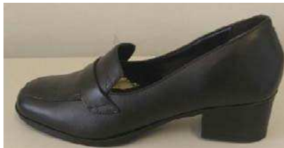
Sapato preto de salto baixo feminino

Descrição: sapato preto social de salto baixo feminino, tipo scarpin , pouco decotado, de bico arredondado, confeccionado em couro, sem enfeites. Apresenta salto médio e largo com 30 mm de altura na cor preta. A parte interna é toda forrada com raspa de couro e tecido. Com solado de borracha vulcanizada ou de couro. Sua posse é obrigatória para todas as Inspetoras, Subinspetoras, Classes Distintas Femininas e Guardas Civis Femininas. Seu uso se dá em atividades de cunho administrativo ou social em composição com o uniforme com saia reta ou calça social. Fica vedado o uso do sapato preto social de salto baixo em conjunto com a calça operacional.