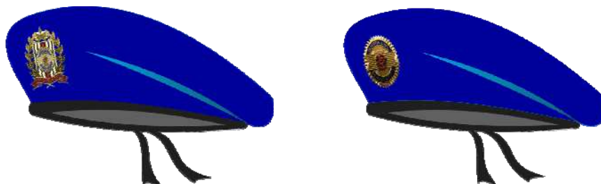
Boina azul - ultramar – modelo francês – Ronda Disciplinar Oficial

Descrição: em feltro de lã de cor azul-ultramar, código Pantoni 193952 TC, modelo francês, unissex, resistente à água, forro interno em viscose na cor preta, de forma circular, botão de pressão na lateral. Na copa, no lado oposto ao reforço, existem dois ilhoses de alumínio para ventilação, na cor preta, de diâmetro variável de acordo com os tamanhos especificados. Debruada com napa de 10 mm de altura, por onde corre um cadarço de algodão de cor preta de 10 mm de largura, que se destina ao ajustamento da boina. Internamente possui um reforço de plástico de formato semicircular com 60 mm de raio, destinado a servir de suporte ao emblema de metal. Podendo ser confeccionada em 100% lã virgem ou pelo de lebre desde que obedecidas as especificações, em particular aquela relacionada à cor.